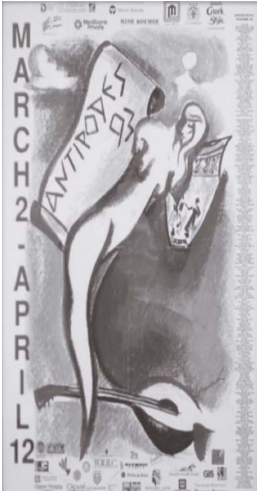
Διαφημιστικά και το Πρόγραμμα του Φεστιβάλ “Αντίποδες” που διεξάγεται στη Μελβούρνη από την Ελληνική Κοινότητα της Μελβούρνης, κατά το μήνα Μάρτιο, σε συνεργασία με τη Γενική Γραμματεία Απόδημου Ελληνισμού και τη βοήθεια χορηγών.