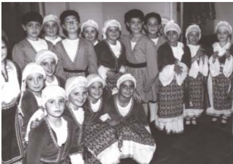
Μαθήτριες του Σύδνεϋ μετά από μια εκτέλεση χορού στην αίθουσα του σχολείου του "Αγίου Σπυρίδωνα", στο Σύδνεϋ.

Σε όλες τις πόλεις της Αυστραλίας λειτουργούν σχολές χορού, με προτεραιότητα τους εθνικούς χορούς.