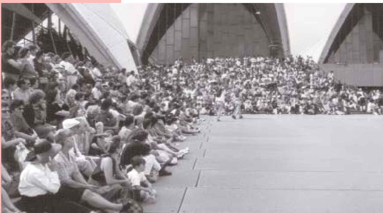
Επίσημο άνοιγμα του 10ου Ελληνικού Φεστιβάλ στην Όπερα του Σύνδεϋ (1992).

Από το 1952, πάνω από 35.000 Πόντιοι, κυρίως από τη Μακεδονία, εγκαταστάθηκαν στην Αυστραλία, οι περισσότεροι από τους οποίους στη Μελβούρνη και στο Σύδνεϋ.