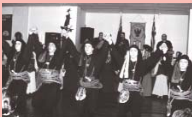
Νεαροί Πόντιοι χορεύουν παραδοσιακούς χορούς το 2002, στο Σπίτι των Ποντίων της Μελβούρνης.