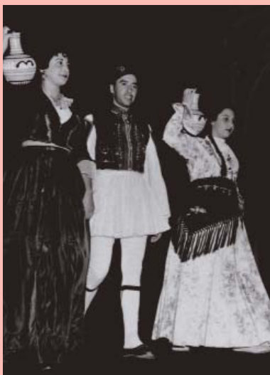
Θεατρική παράσταση με αφορμή την 25η Μαρτίου στην Καμπέρρα το 1949.

Από τις αρχές του 1910 ορισμένοι Έλληνες εντάχθηκαν σε αυστραλιανούς θεατρικούς ομίλους και έπαιξαν διάφορους ρόλους στα θέατρα του Σύδνεϋ και της Μελβούρνης. Στα μέσα της δεκαετίας του 1920 έφθασαν στην Αυστραλία οι πρώτοι περιοδεύοντες θίασοι από την Ελλάδα, ενώ στις αρχές του 1930 αρκετοί σύλλογοι ανέβαζαν θεατρικά έργα για να συγκεντρώσουν χρήματα για την εκκλησία και το ελληνικό σχολείο.