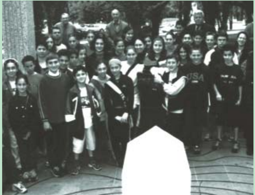
Μαθητές των απογευματινών σχολείων επισκέπτονται το Ελληνοαυστραλιανό Μνημείο στη Μελβούρνη και τους εξηγείται η σπουδαιότητα της Μάχης της Κρήτης και η συμμετοχή 17.000 Αυστραλών στρατιωτών στο μέτωπο της Ελλάδας, εναντίον των Γερμανών και Ιταλών κατακτητών.