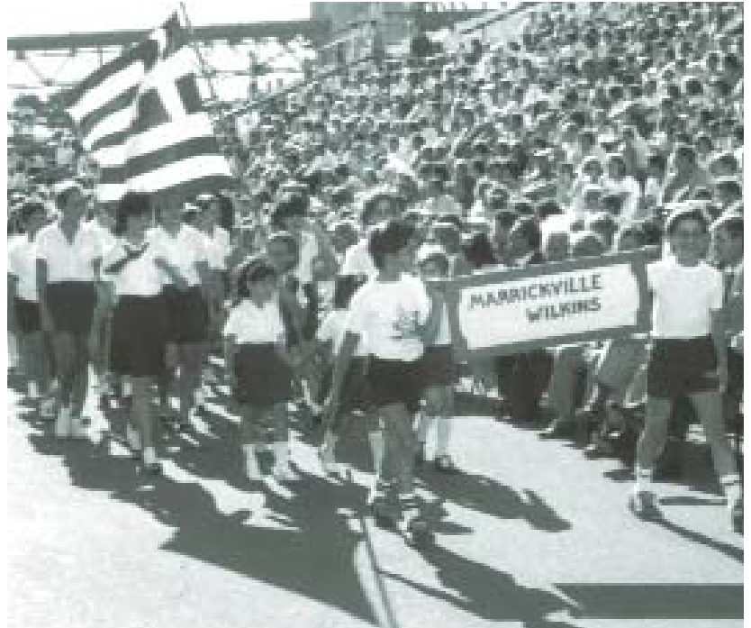
Μαθητές και μαθήτριες Ελληνικού σχολείου της Ελληνικής Κοινότητας Σύδνεϋ, γιορτάζουν την 25η Μαρτίου μπροστά στην Όπερα του Σύδνεϋ.

Με κλαδιά ελιάς και την Ολυμπιακή Σημαία οι μαθήτριες της φωτογραφίας στέλνουν το μήνυμα της ειρήνης στον κόσμο, κατά τη διάρκεια παρέλασης με την ευκαιρία της 25ης Μαρτίου 1999.