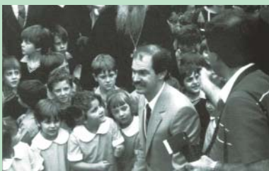
Κοντά στους μικρούς μαθητές και μαθήτριες του Κολλεγίου "Άγιος Ιωάννης" βρέθηκε ο τότε υπουργός Παιδείας της Ελλάδας, Γεώργιος Παπανδρέου (Μελβούρνη 1984).

Με κλαδιά ελιάς και την Ολυμπιακή Σημαία οι μαθήτριες της φωτογραφίας στέλνουν το μήνυμα της ειρήνης στον κόσμο, κατά τη διάρκεια παρέλασης με την ευκαιρία της 25ης Μαρτίου 1999.