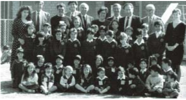
Με τους μικρούς μαθητές και μαθήτριες του ελληνικού Ορθοδόξου Κολλεγίου του Αγίου Ανδρέα, στην Πέρθη, φωτογραφίζεται η Πρωθυπουργός της Δυτικής Αυστραλίας, Carmen Lawrence, το 1991.