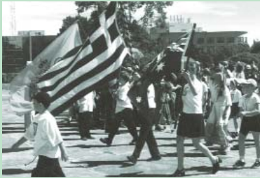
Η συμμετοχή των δασκάλων και των γονέων είναι εντυπωσιακή στις παρελάσεις των σχολείων (1990).