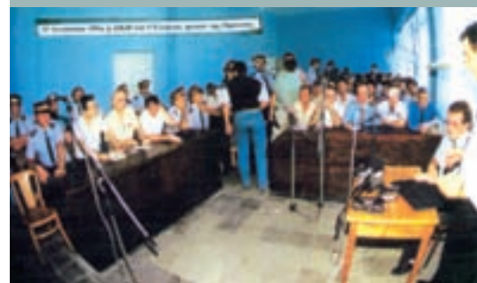
Από τη δίκη των πέντε Ελλήνων ηγετών της Ομόνοιας (1994)