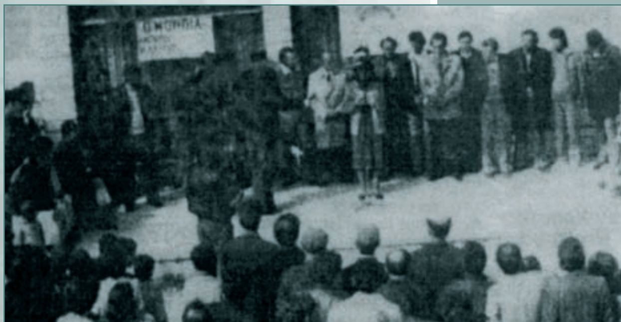
Άποψη από τη μεγάλη συγκέντρωση του πρώτου συλλαλητηρίου της «Ομόνοιας» στις 28.2.1991 στο Γεωργουτσάτι Δρόπολης Αργυροκάστρου