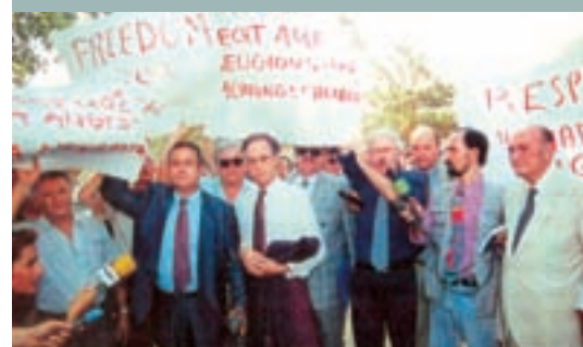
Διαμαρτυρίες κατά της ΔΙΚΗΣ των Ελλήνων. Προσωπικότητες από Ελλάδα, Αλβανία, κλπ. συμμετέχουν