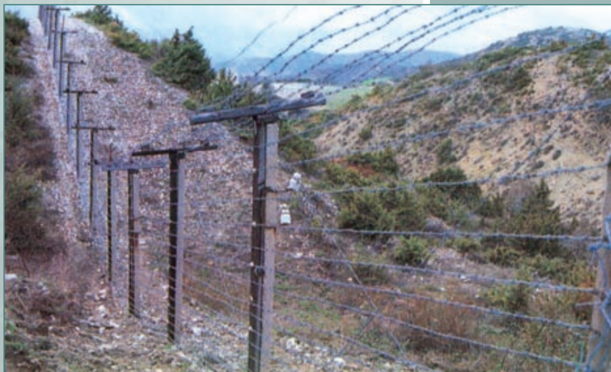
Τα ηλεκτροφόρα συρματοπλέγματα επί 46 χρόνια 1944-1990 μετάτρεψαν την Αλβανία σε φυλακή