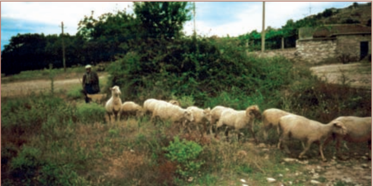
1998, Γράψη - Ο Γιάννης Ντούσης με τα πρόβατά του