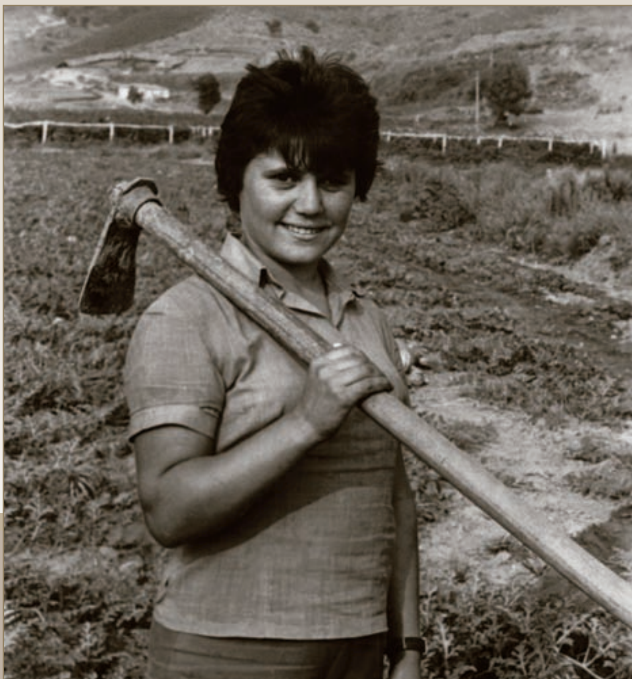
Αγρότισσα ελληνικής καταγωγής την περίοδο του κομμουνιστικού καθεστώτος (1967)