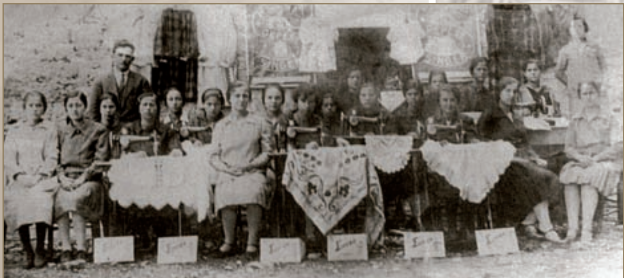
Δρόβιανη Δελβίνου. Φροντιστήριο Ραπτικής (δεκαετία 1920-1930)