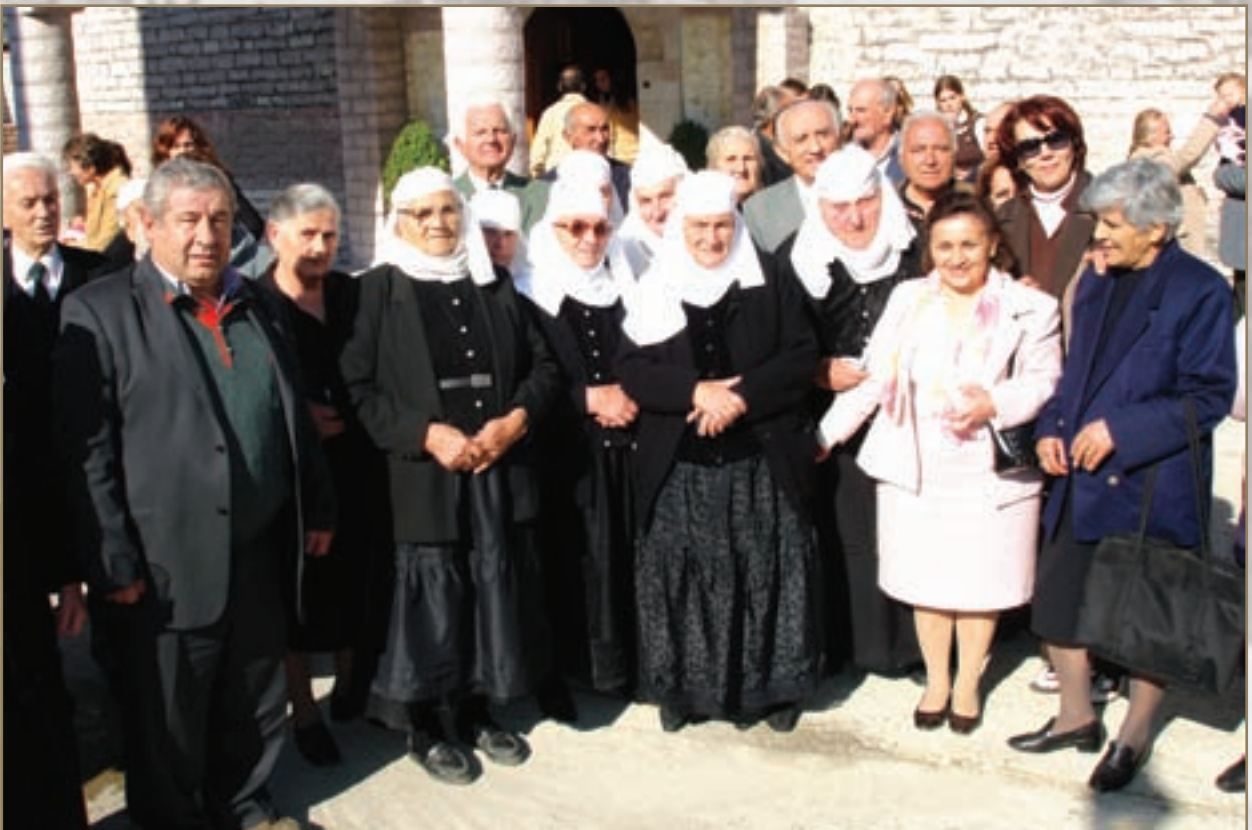
Επίσκεψη Γιαννιωτών στη Δερβιτσάνη, Δερόπολη 6-11-2005