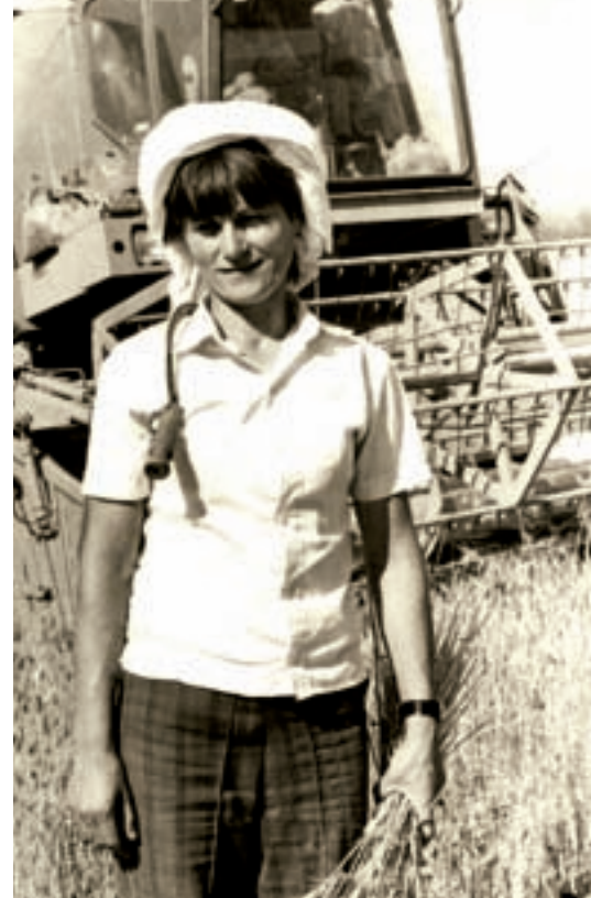
Ακούραστη η Δεροπολίτισσα στο θέρος (1980)

Σύμφωνα με την αλβανική απογραφή του (1989) κατά την οποία λήφθηκε υπόψη το κριτήριο της εθνικής καταγωγής, οι Έλληνες υπολογίζονται σε 58.758. Τα στοιχεία της απογραφής θεωρήθηκαν εξαιρετικά ελλιπή, αφού αφορούσαν μόνο τα διαμερίσματα Αγίων Σαράντα, Δελβίνου και Αργυροκάστρου.