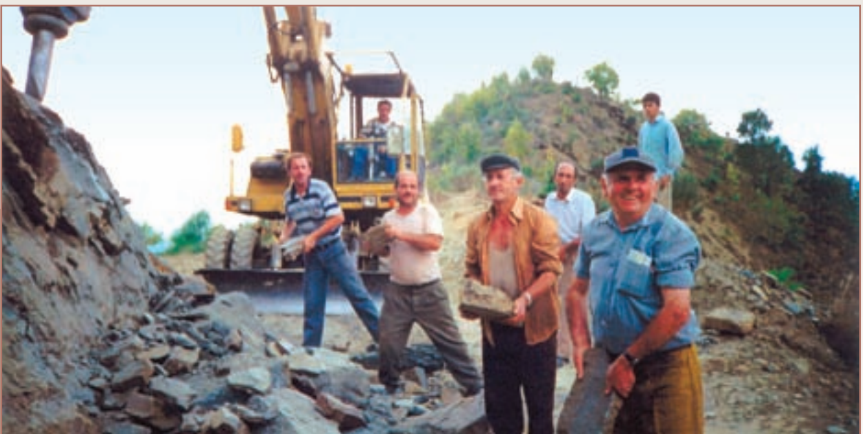
Εργάτες ανοίγουν δρόμο στο Πωγώνι. Σωπική (2000)